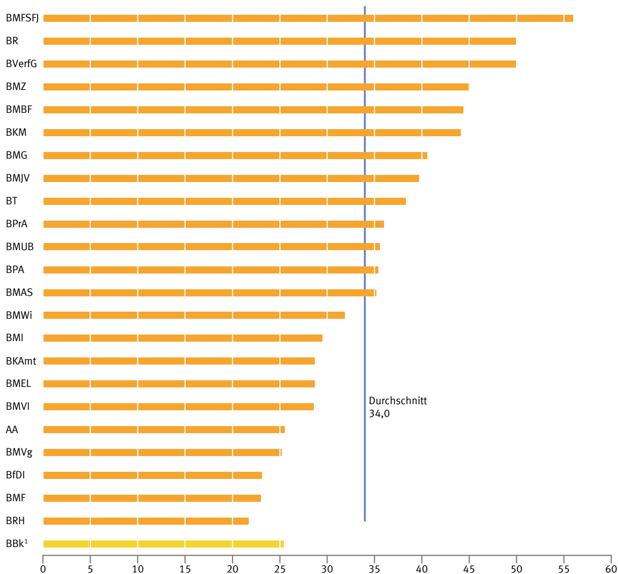
Abb 1 Frauenanteil an allen Leitungsfunktionen in den obersten Bundesbehörden am 30. Juni 2016 in %

1 Beschäftigte der Laufbahngruppen des höheren, gehobenen und mittleren Dienstes mit Vorgesetzten- oder Leitungsfunktionen.