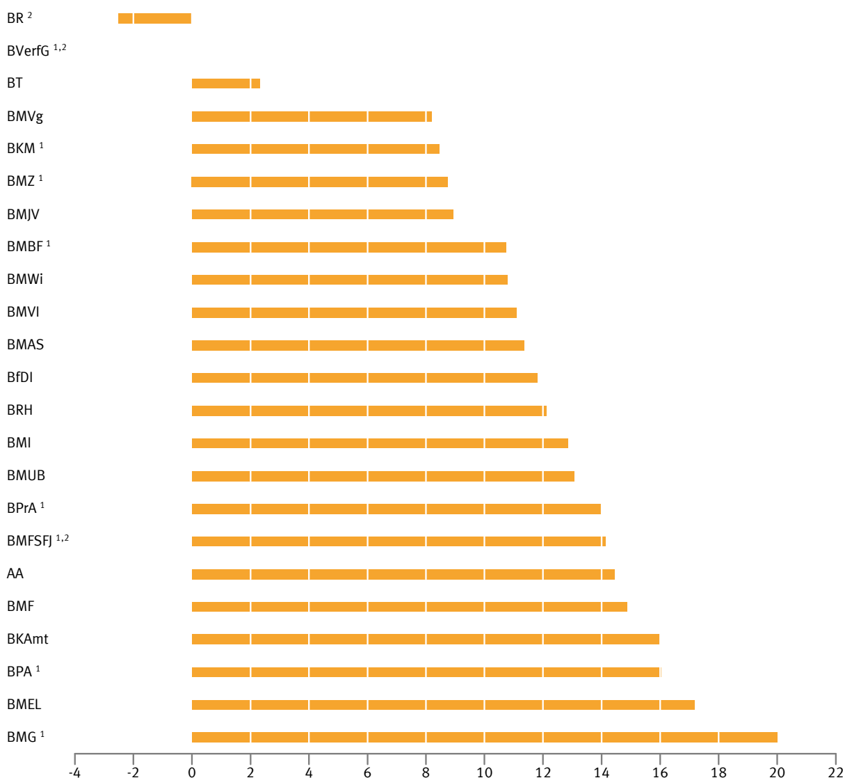
Abb 2 Unterschied zwischen dem Frauenanteil im höheren Dienst und dem an allen Leitungsfunktionen in den obersten Bundesbehörden am 30. Juni 2016 in Prozentpunkten