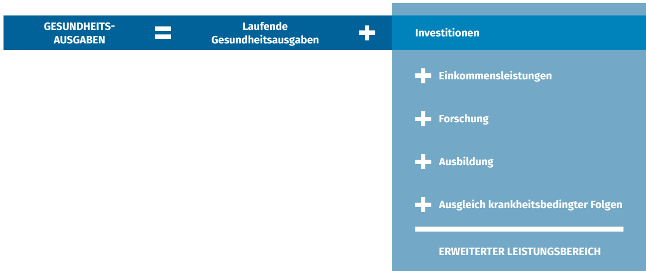
Abbildung 1 Zusammensetzung der Gesundheitsausgaben und des erweiterten Leistungsbereichs

In der GAR werden nur die Ausgaben für die letzte Verwendung von Waren und Dienstleistungen sowie Investitionen ermittelt. Eine Bedingung dafür ist, dass die gesundheitsrelevanten Transaktionen für gewöhnlich eine direkte Beteiligung der Patientinnen und Patienten bzw. der Bevölkerung voraussetzt. Vorleistungskäufe werden daher nicht in der GAR berücksichtigt.