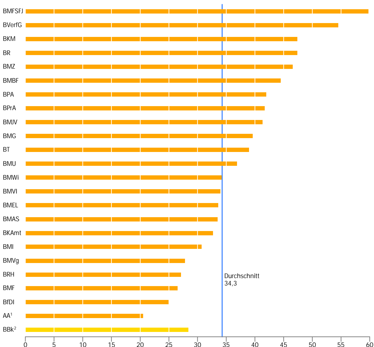
Abb 1 Frauenanteil an allen Leitungsfunktionen in den obersten Bundesbehörden am 30. Juni 2018 in %