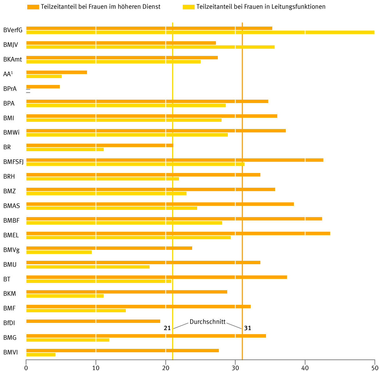
Abb 4 Teilzeitanteil bei Frauen in den obersten Bundesbehörden am 30. Juni 2018 in %