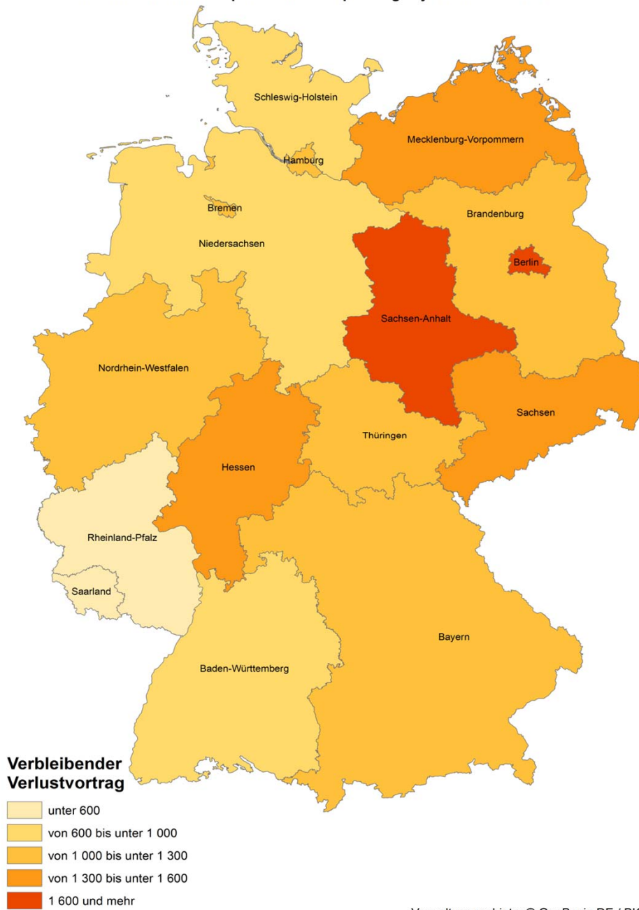
Durchschnittlicher verbleibender Verlustvortrag der unbeschränkt Körperschaftsteuerpflichtigen je Bundesland in 1000 EUR